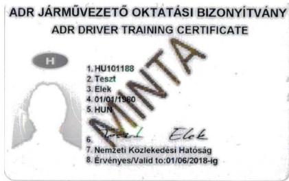
1. ábra – ADR járművezetői bizonyítvány minta